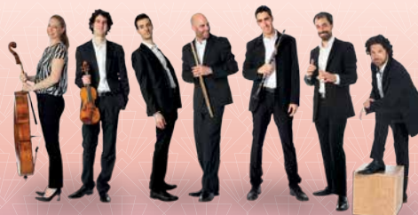
ISRAELI CHAMBER PROJECT